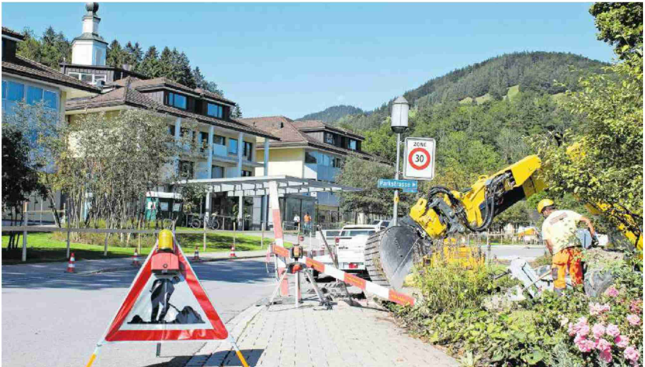
Seit Dienstag um sieben Uhr wird im und um das Hotel Hof Weissbad gebaut.

Die Hof Weissbad AG baut ein Bade- und Saunahaus sowie einen Seminarpark. Das Hotel bleibt sechs Wochen zu.