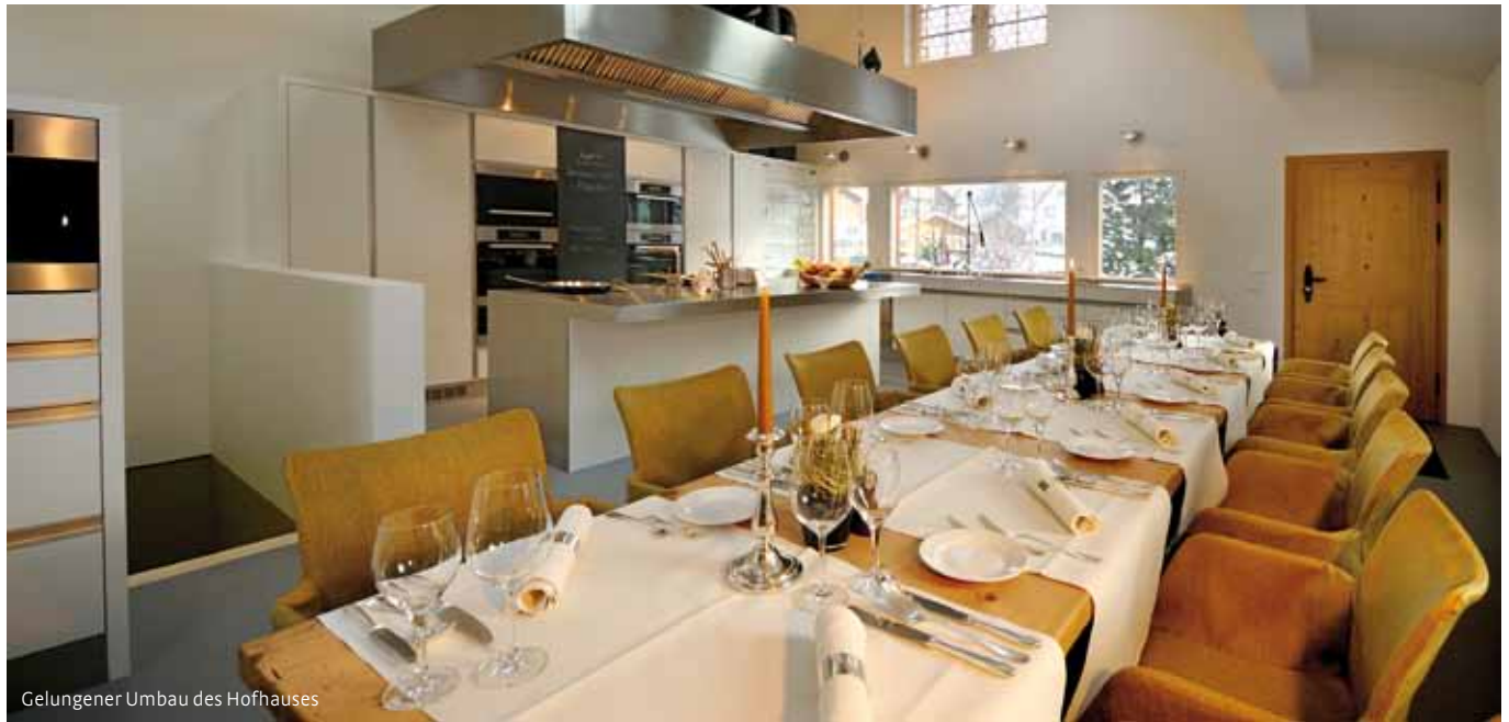
Gelungener Umbau des Hofhauses