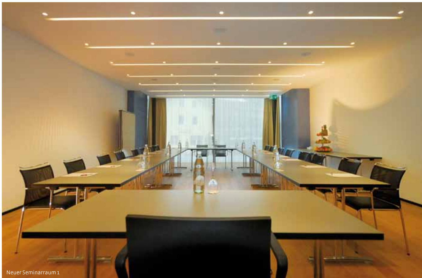
Neuer Seminarraum 1